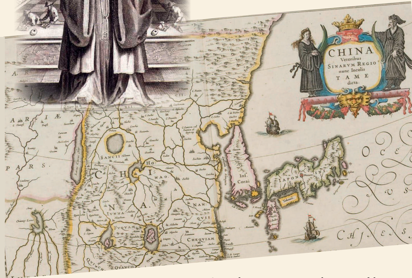
Phil. Masson: Dissertation Critique sur la Langue Chinoise , 1713.

Eine Sammlung aus europäischen Periodika von 1665 bis 1727